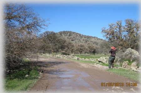
Foto van vogelverschrikker, hier zaten voorheen 2 honden i.p.v. een hond ieder aan één kant van de weg.

Stavros (onze boswachter op locatie) heeft de kettinghonden in kaart gebracht, gefotografeerd en geregistreerd. Waar mogelijk heeft hij de eigenaren aangesproken en verteld dat wat zij doen verboden is volgens de wet. Bij de honden waar geen eigenaar gevonden werd heeft hij een brief achtergelaten bij de hond. Tijdens de tweede ronde heeft Stavros heel wat verbeteringen aangetroffen en bij een aantal locaties was de hond daadwerkelijk weggehaald. Soms vervangen door een alternatief bewakingsobject. In totaal zijn er ongeveer 300 kettinghonden geregistreerd. Onder de foto's vind u het persbericht uit Lesbos met de resultaten van dit project tot nu toe. Met die resultaten zijn wij heel erg blij, het is een heel goed begin van een waarschijnlijk langlopend traject.