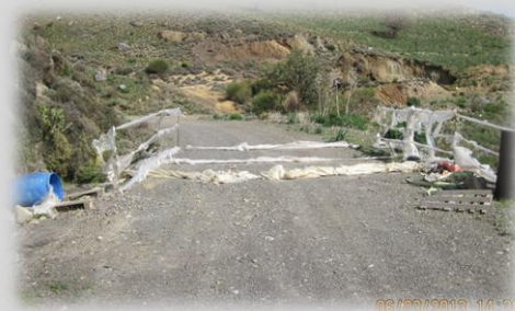
Plastic om de schapen af te schrikken