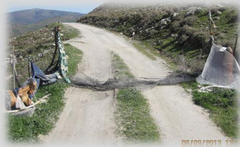
Links op de foto ziet u een oud hobbelpaard i.p.v. een hond